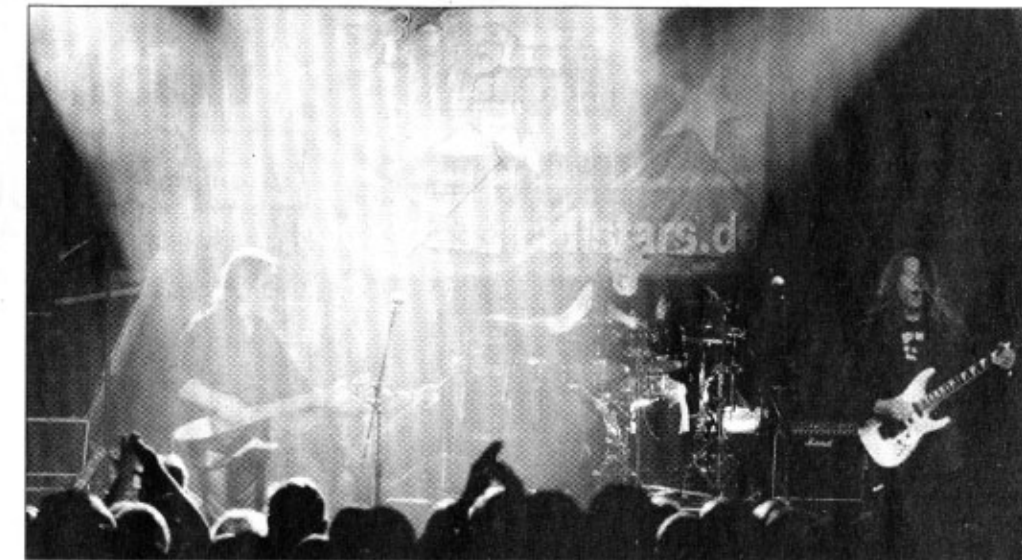
Keine Cover-Versionen, alles original: Die Allstars geben sich am 7. Februar an der Hellbachstraße das Mikro in die Hand.

Mit ihrer Band, allesamt Profimusiker, können die Stars aber auch anders. „Wir spielen auch Rammstein“, sagt der Organisator. Was 2003 mit einem Benefizkonzert in der Bochumer Zeche begann, hat sich längst zu einem weltweiten Renner mit gut 120 Auftritten im Jahr ent-